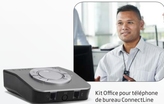
Kit Office pour téléphone de bureau ConnectLine