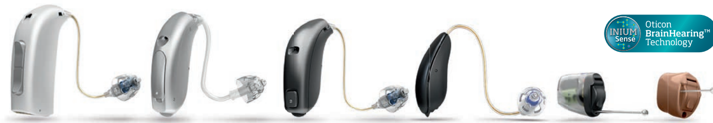
Représentation à l'échelle des aides auditives. Disponibles dans d'autres coloris.