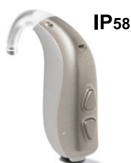
P BTE avec design en forme de S de Bernafon

Grâce à un niveau de sortie maximum de 138 dB SPL, cette aide auditive est idéale pour les clients souffrant de pertes auditives légères à sévères allant jusqu'à 100 dB HL.